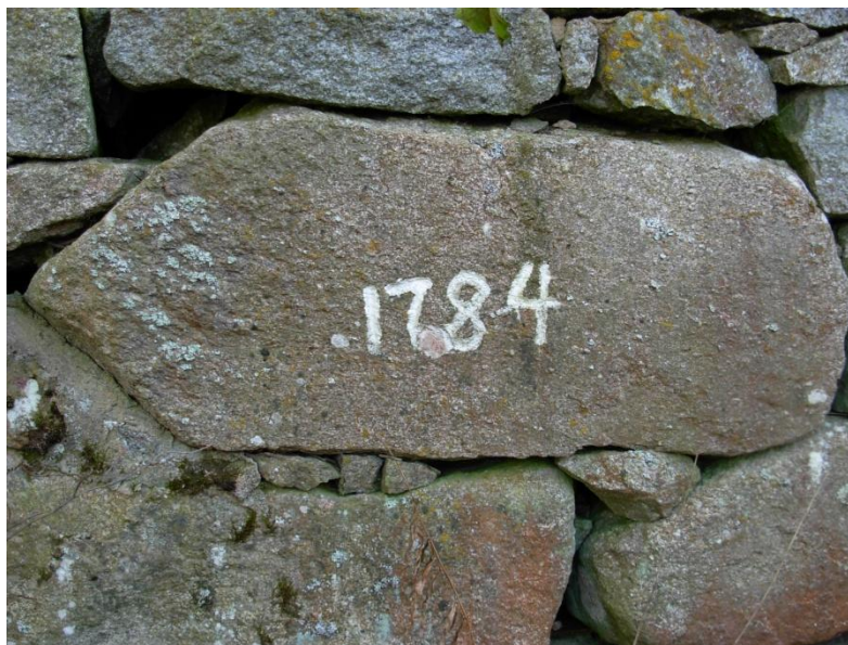
2.2: Byggdes år 1784 som hammarsmedja. Ombyggdes år 1900 till kvarn.