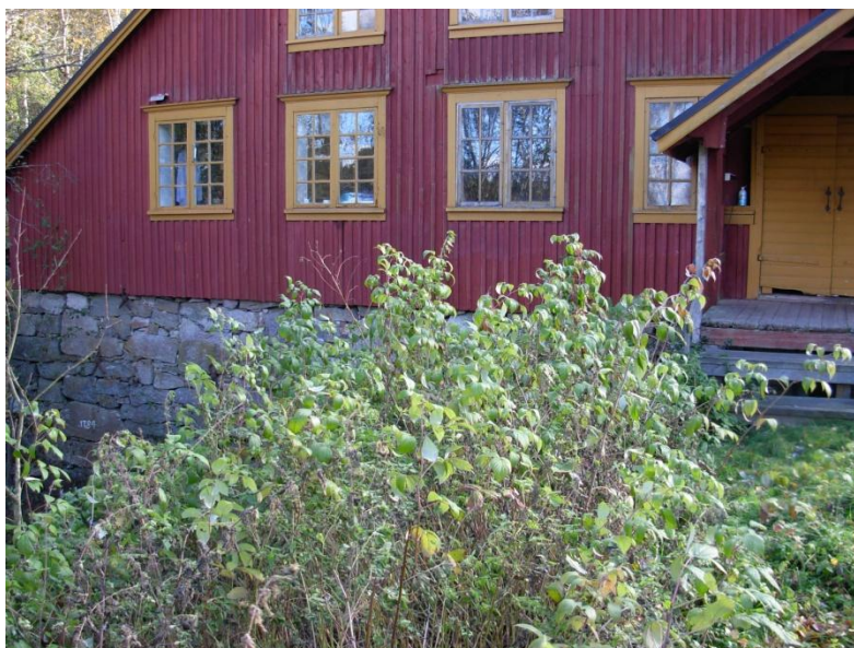
2.3; Årtalet syns nere till vänster.