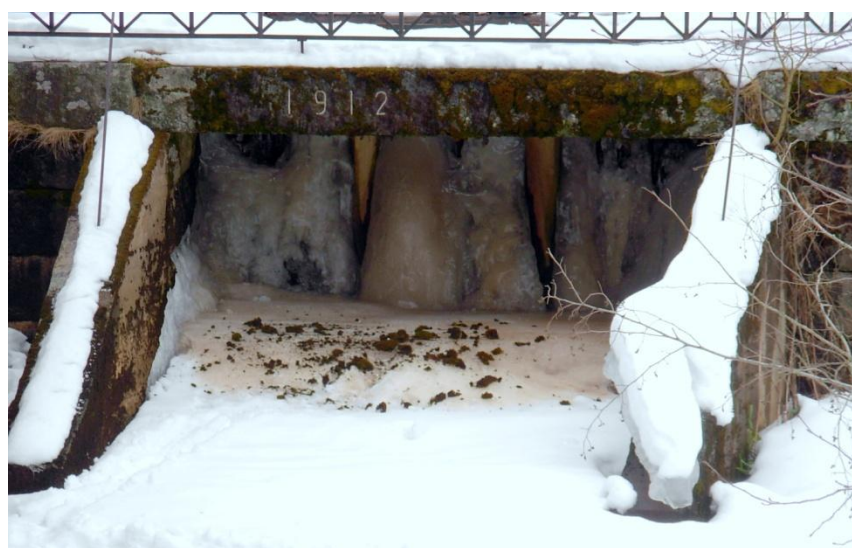
6.3: Stödkonstruktionen i betong byggdes i mitten på 1950-talet.