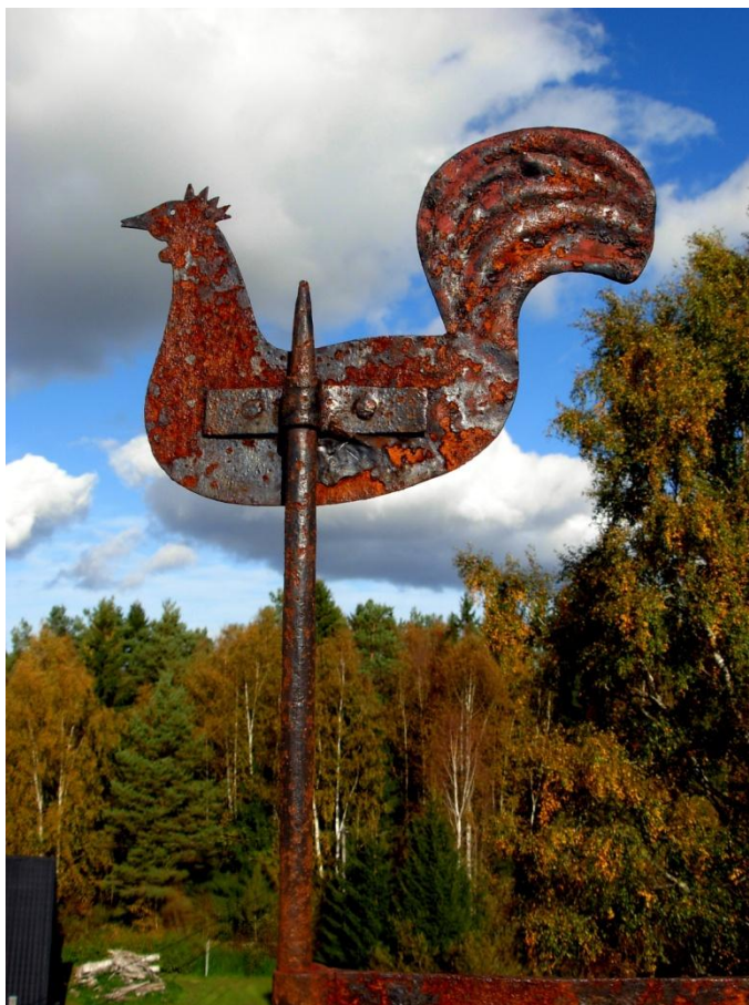
8.7: Tuppen uppe i klockstapelns spira.