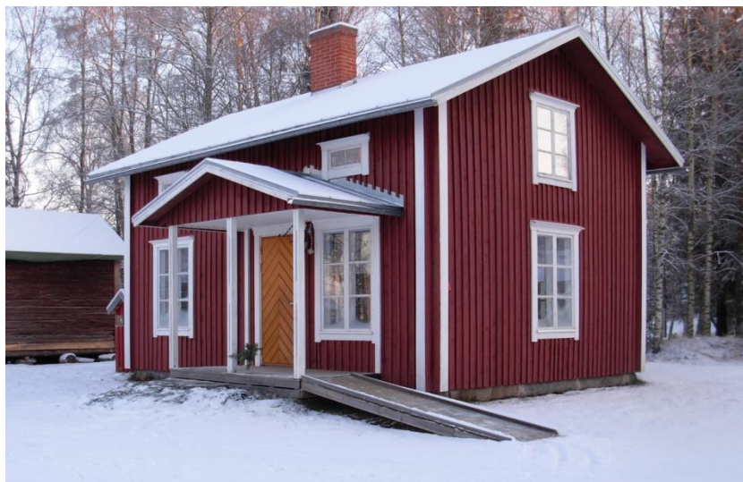
9.1: Stugan flyttad till bruket från Kullbacken i Kimo.