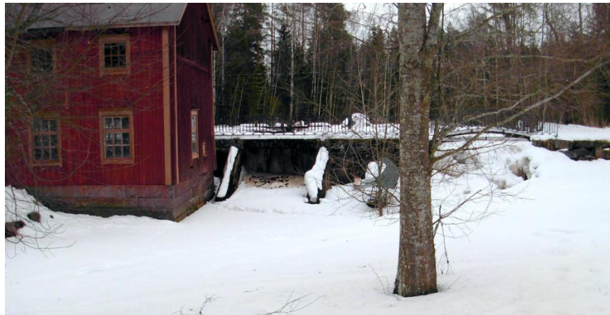
6.1: Dammen byggdes för verkstadens kraftbehov. Kraftverksdamm från år 1922.