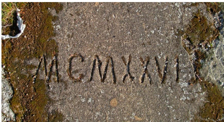
1.4: MCMXXVI = 1926 året när dammens båda flodvattenutskov ombyggdes.