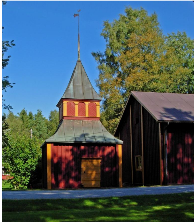
8.1: Byggdes år 1763.