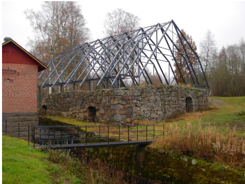
4.1: Hammarruinen fotograferad i oktober 2009.