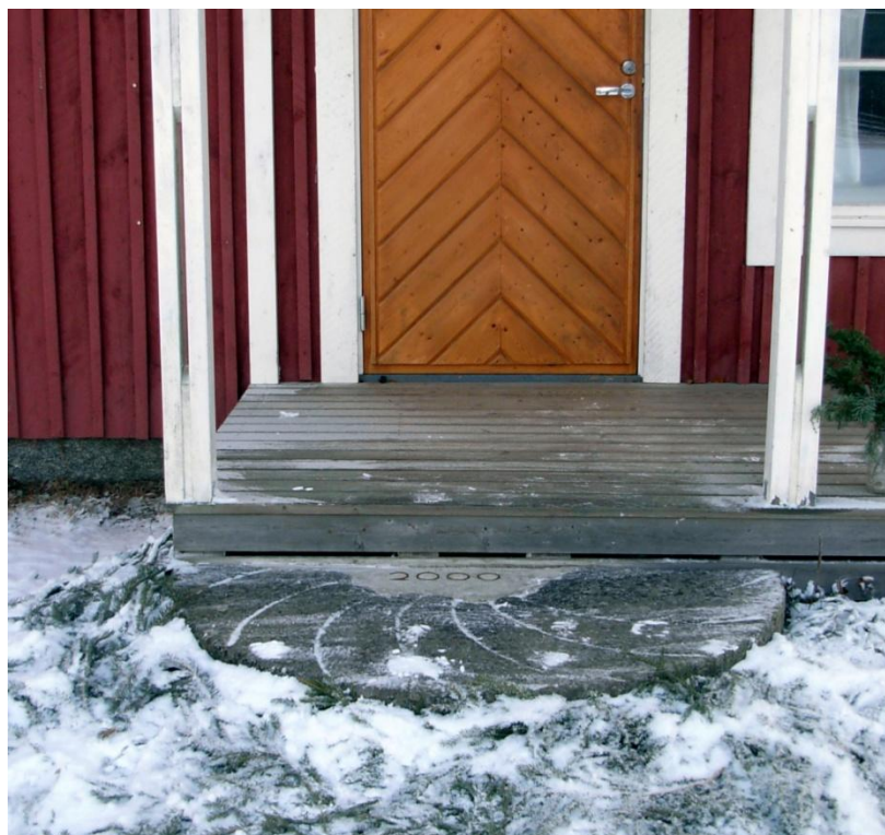
9.2: Årtalet ingjutet i trappan.