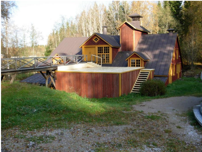
2.1: Kyroboas kvarn. Stängdes år 1978. I nutid kvarnmuseum.