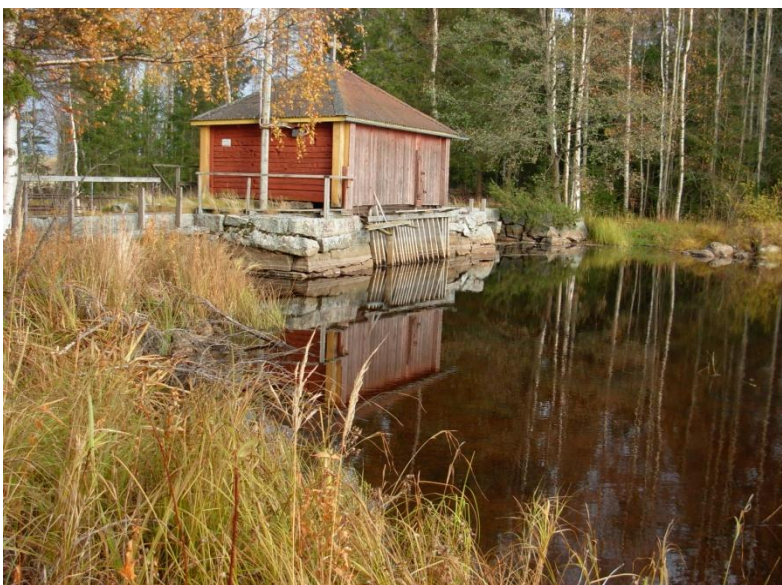
1.2: Hålldammen vid Lillforsen.