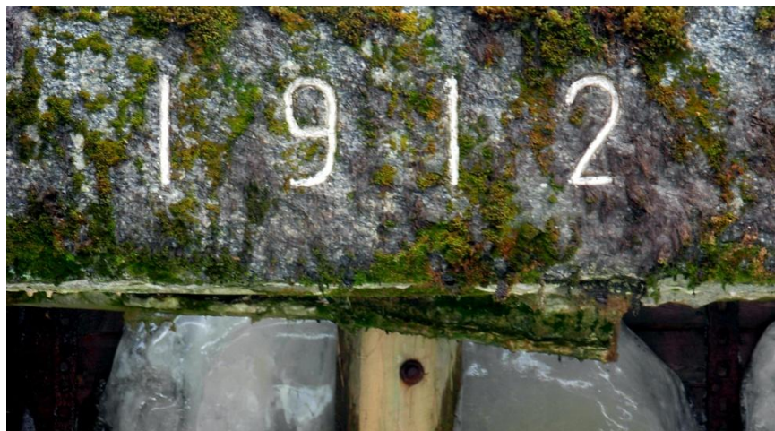
6.2: 1912 Årtalet då dammen byggdes.