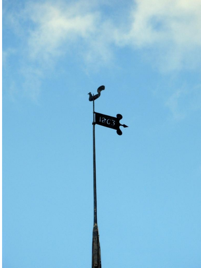
8.6: Tornspiran med vindflöjel och tupp nymålade.