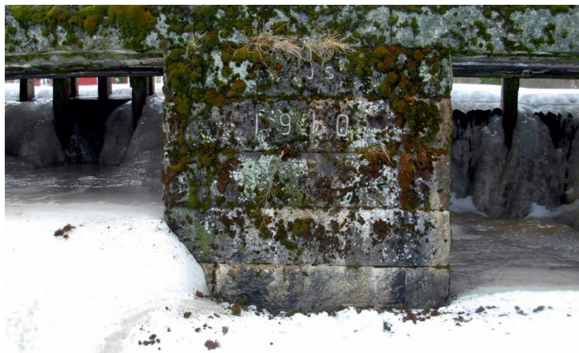
5.2: Dammkroppen byggd i kilad sten.