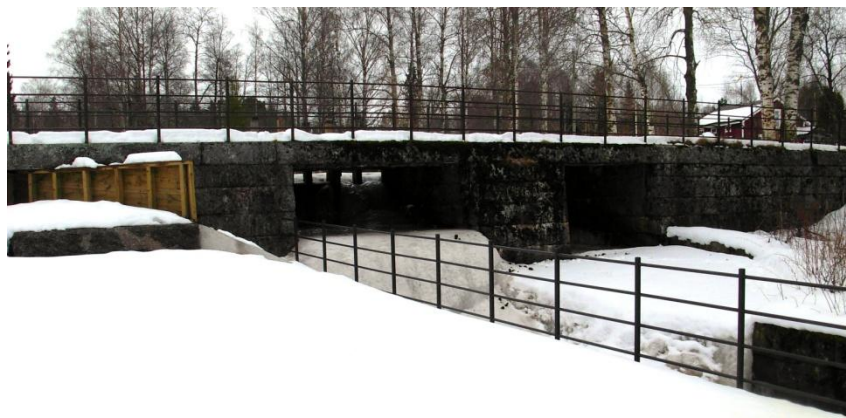
5.1: Dammen i vinterskrud.