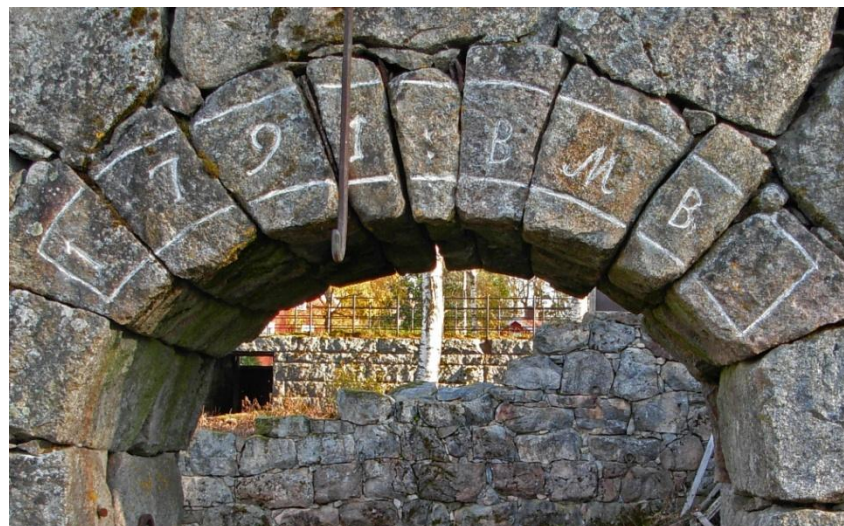
4.2: 1791= året när hammarsmedjan byggdes