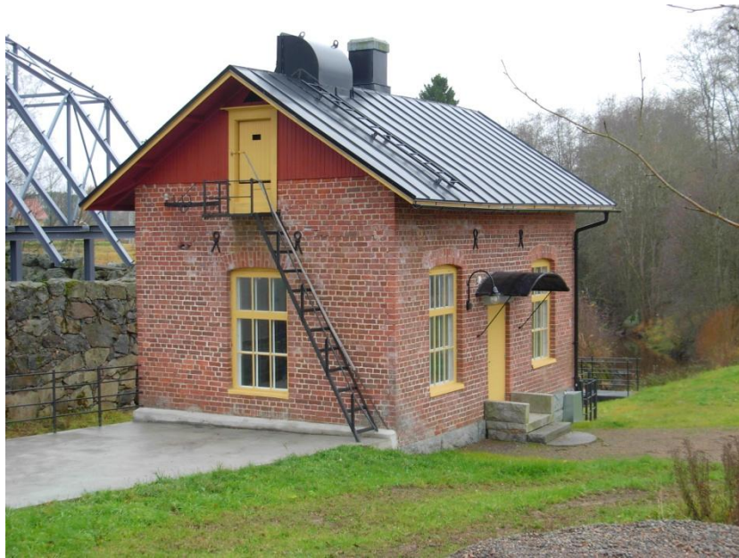
7.1: I bruk från år 1922 till 1984. Efter ombyggnad på nytt i drift från år 2008.