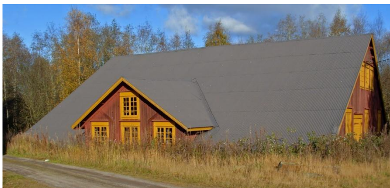
3.1: Nyhammaren. Ombyggd till såg på 1890-talet.