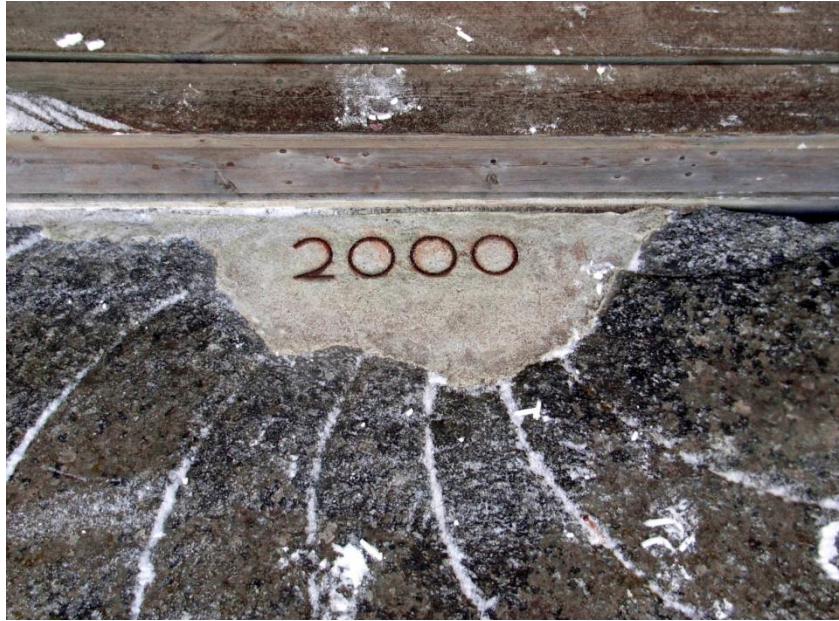
9.3: Flyttades till bruket år 2000.