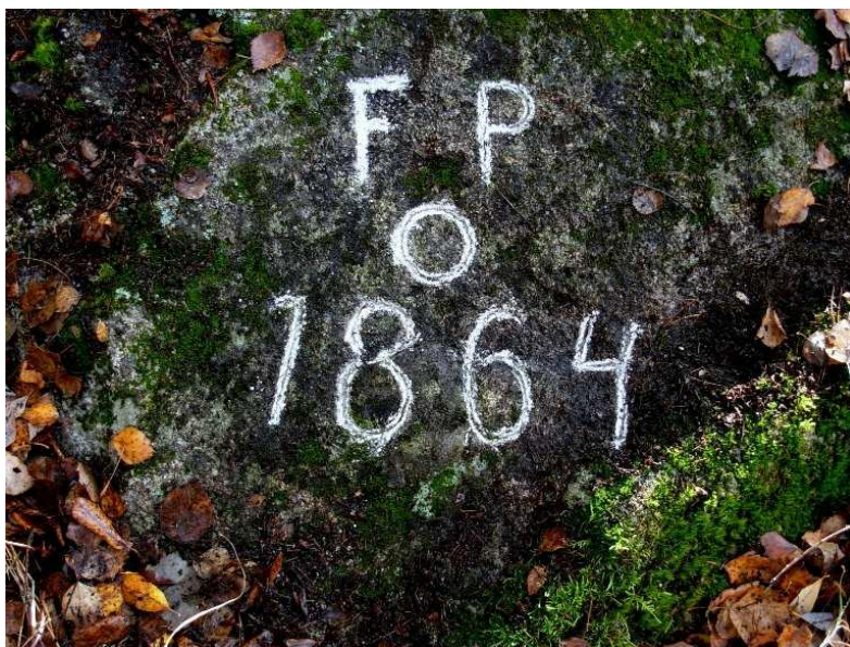
1.3: FP O 1864 = Högsta lagliga uppdämning inmejslat år 1864.